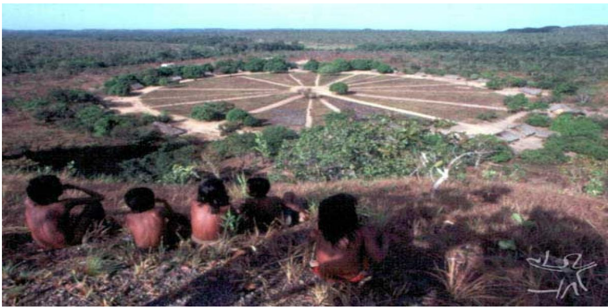
Exemplo de aldeia Krahô em formato de sol