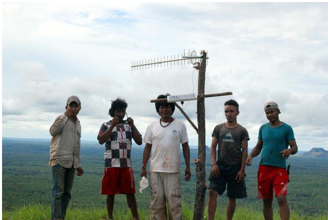
Group of Krahô Warriors on a mission in 2021